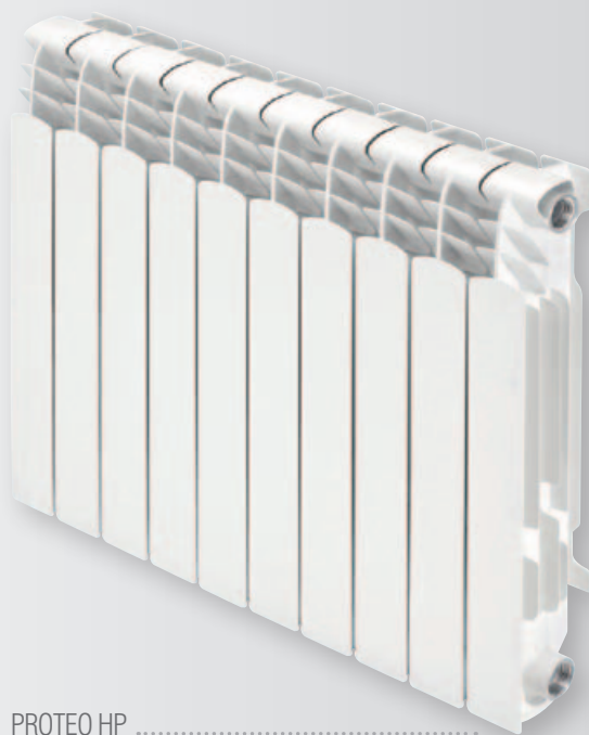
PROTEO HP .....