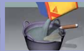
Uz lagano mešanje dodavati prah u vodu.