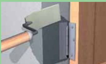
Naneti mistrijom sloj ne deblji od 2 cm. Temperatura nanošenja: +5 °C do +35 °C.

Potrošnja: od 1 kg praha dobija se približno 0,5 litara maltera. Izbegavati nanošenje materijala pri direktnoj sunčevoj svetlosti i/ili jakom mrazu i/ili kiši.