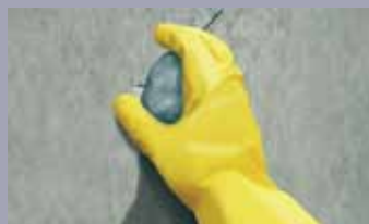
Ovako nastaviti oko mesta prodora dok se curenje u potpunosti ne zaustavi. Po potrebi, čepove raspodeliti oko centralnog mesta prodora tečnosti i na kraju potpuno zaustaviti curenje jednim čepom u sredini. Višak materijala ukloniti gletericom.