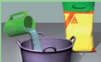
Sipati vodu u posudu za mešanje 1 kg praha: ~ 0,18 l vode.

Podloga mora biti zdrava i bez tragova prašine, trošnih i rasutih delova.