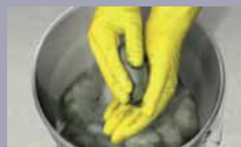
Rukom brzo mešati malter i vodu u dovoljnoj količini za formiranje čepa koji se nanosi u roku od nekoliko sekundi.