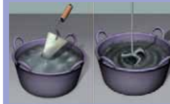
Može se mešati ručno ili električnom mešalicom (< 500 obrtaja) najmanje 3 minuta dok se ne postigne potrebna konzistencija