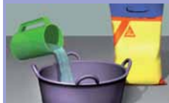
Sipati vodu u posudu za mešanje na 1 kg praha: ~ 0,25 l vode