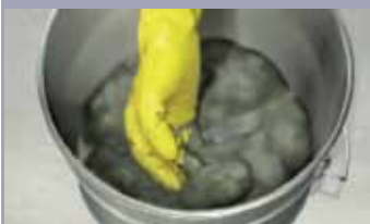
Mešati u malim količinama ručno uz obavezno korišćenje rukavica ~ 0,28 l vode sa 1 kg praha. Mešati samo onu količinu materijala koja može da se nanese u okviru roka upotrebe od otvaranja pakovanja