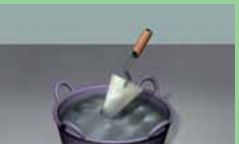
Mešati ručno najmanje 30 sekundi dok se ne dobije neophodna konzistencija