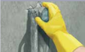
Nakon formiranja čepa od maltera nastaviti nekoliko sekundi sa obradom smeše dok ne počne da se stvrdnjava i stvara malo toplote. Čep odmah utisnuti u procurelu površinu, počevši od dna i čvrsto pritiskati u trajanju od 20-30 sekundi dok se ne zaustavi prodor vode