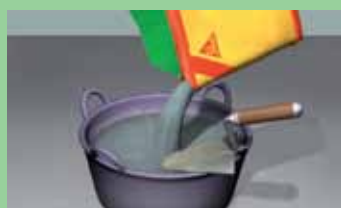
Uz lagano mešanje dodati prah u vodu.